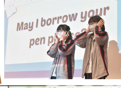
"Can You Hear Me?"