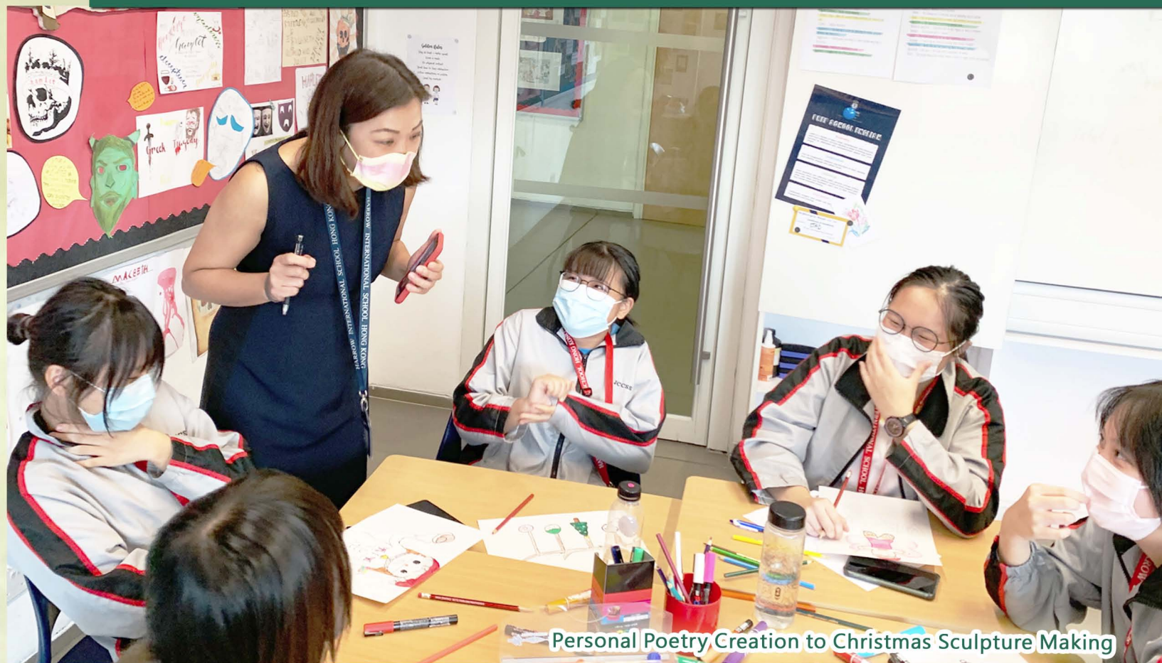
Personal Poetry Creation to Christmas Sculpture Making