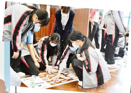
Students were looking for words according to the themes given.