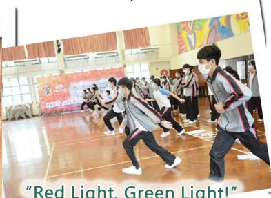
"Red Light, Green Light!"