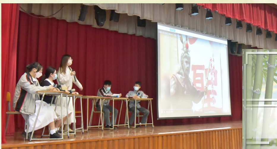
盧璫芝老師和四位同學介紹章回小說《西遊記》