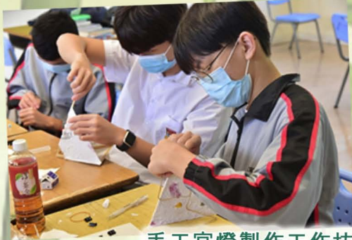
手工宮燈製作工作坊