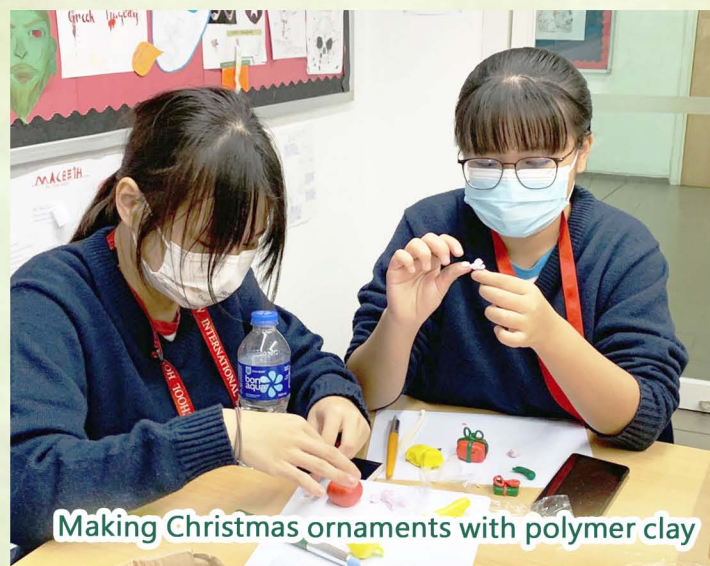
Making Christmas ornaments with polymer clay