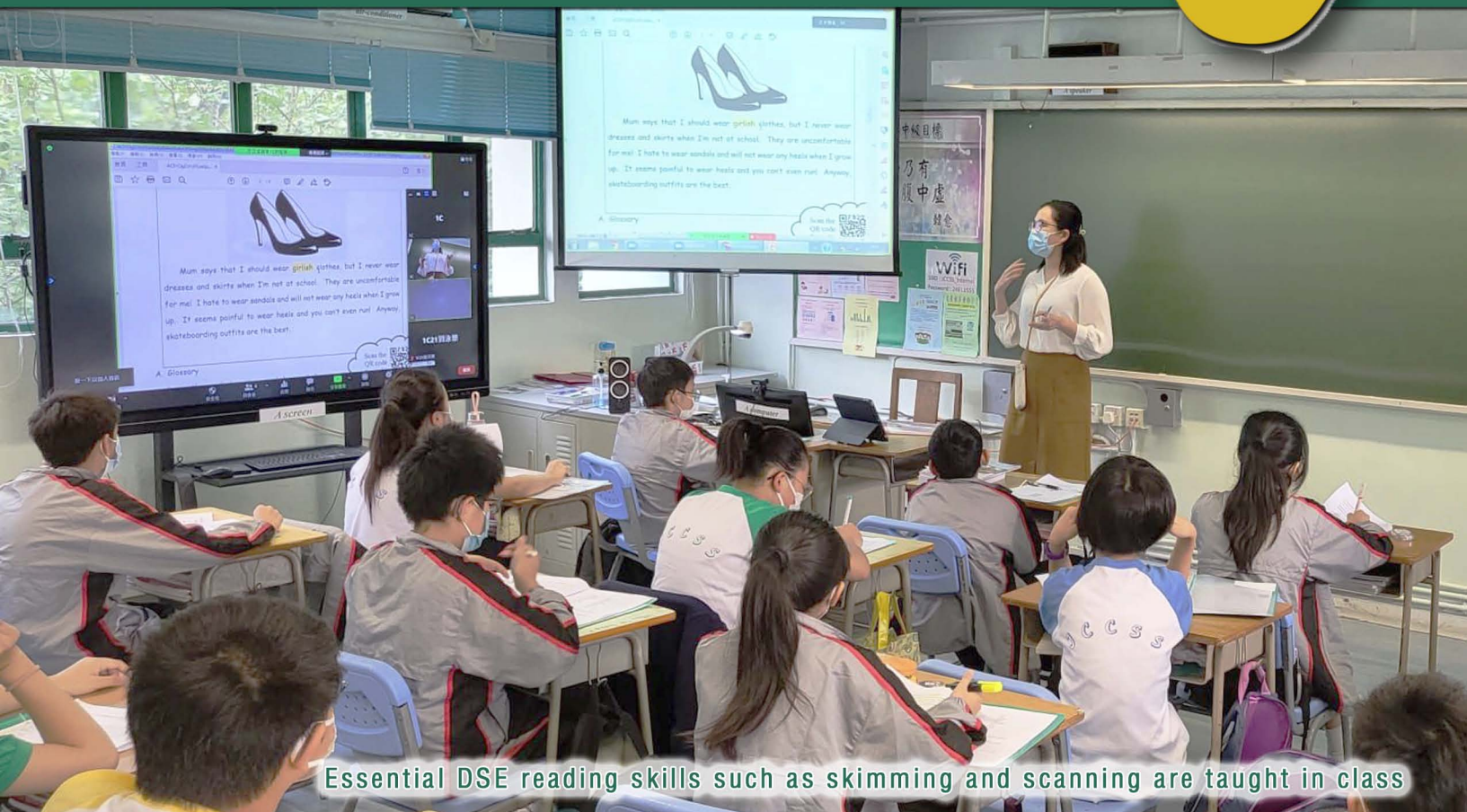
Essential DSE reading skills such as skimming and scanning are taught in class

“Reading is to the mind what exercise is to the body.” Joseph Addison