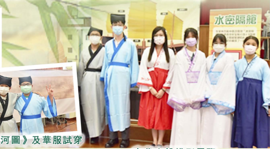
《清明上河圖》及華服試穿

2021年7月22日在本校禮堂舉行的「玩轉宋『潮』歷史文化展」為同學帶來嶄新的學習體驗，陶醉在華美的中國文化之中。