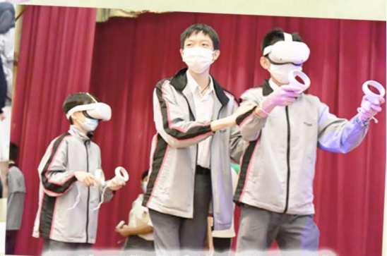
VR讓同學感受歷史的現場感