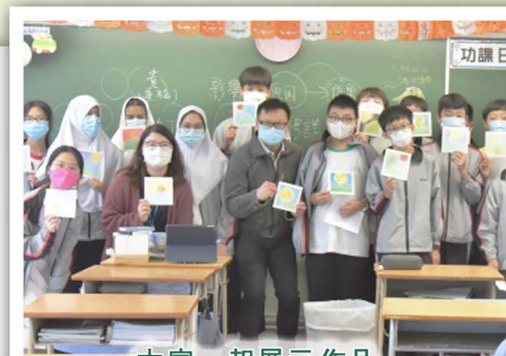
大家一起展示作品