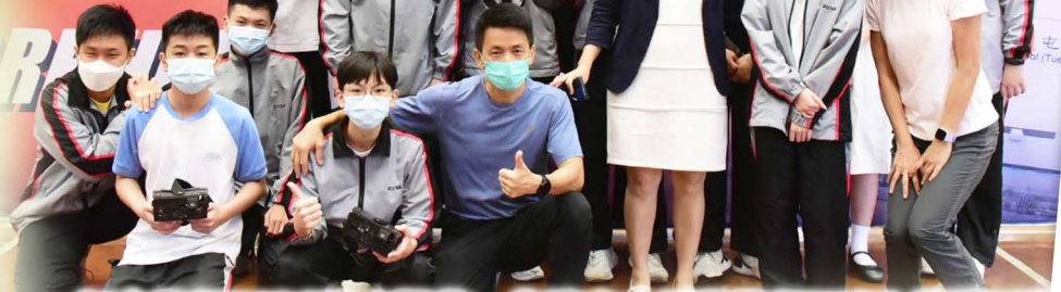
初中進行HADO體育課前，先讓高中同學進行HADO 體驗活動