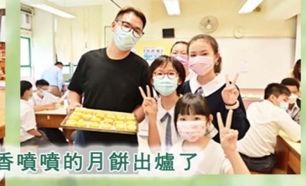
香噴噴的月餅出爐了