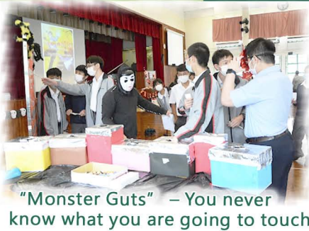
"Monster Guts" – You never know what you are going to touch!