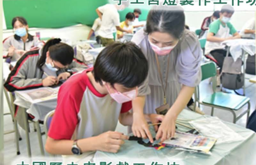
中國歷史皮影戲工作坊