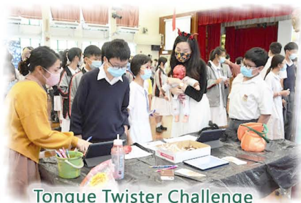
Tongue Twister Challenge