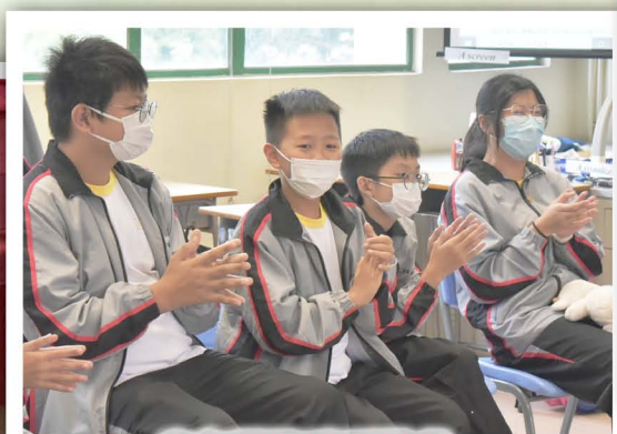
童年回憶系列遊戲