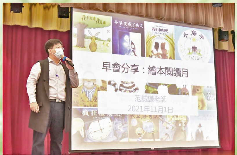
每月也有老師專題介紹導讀相關類別書籍