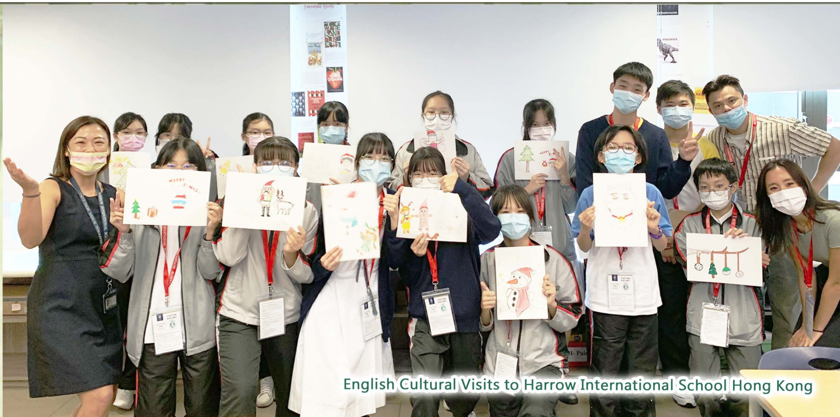
English Cultural Visits to Harrow International School Hong Kong