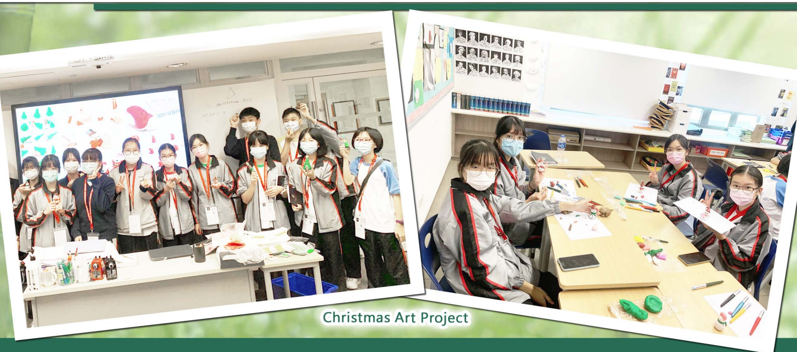
Christmas Art Project

Our pioneering project with Harrow International School Hong Kong has officially kicked off this year - and what a success it has been! Every week, students of JCCSS(TM) enjoy an afternoon of native English classes at one of the world's finest institutions. They are so impressed by Harrow's colossal campus that they do not even want to leave!