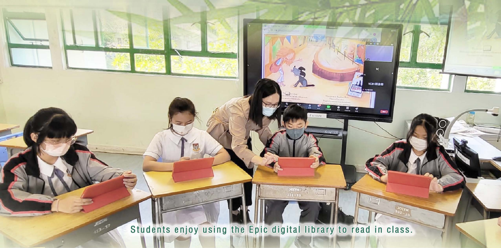
Students enjoy using the Epic digital library to read in class.