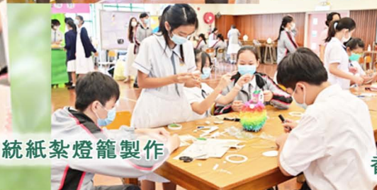
傳統紙紮燈籠製作