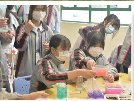
養氣水寶寶工作坊